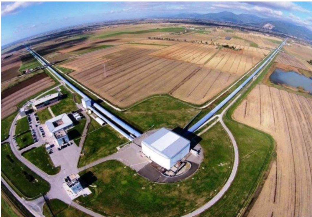
Vue aérienne (novembre 2015) du détecteur Virgo, installé en Italie près de Pise.

Depuis 2007, les collaborations LIGO et Virgo (France, Italie, Pays-Bas, Pologne, Hongrie et Espagne) sont liées par des accords d'échange des données enregistrées par les différents détecteurs. Ces données sont ensuite analysées par les deux collaborations et les résultats publiés dans des articles scientifiques communs. Cette organisation, différente de celle adoptée par exemple en physique des particules 3 , s'explique par le fait que les détecteurs d'ondes gravitationnelles sont tous sensibles aux mêmes signaux en provenance du cosmos. De plus, la détection et l'analyse d'un signal d'onde gravitationnelle transitoire (c'est-à-dire d'une durée finie), demandent plusieurs détecteurs : à la fois pour démontrer que le signal est réel et pour obtenir des informations sur le phénomène qui l'a produit. Par exemple, il faut au moins trois détecteurs pour localiser la position de la source dans le ciel. C'est pour cela que la collaboration Virgo est cosignataire de la découverte alors que son détecteur (Virgo Avancé, situé à Cascina près de Pise en Italie) est encore en phase d'amélioration. D'ici quelques mois, Virgo devrait rejoindre LIGO pour de nouvelles prises de données.